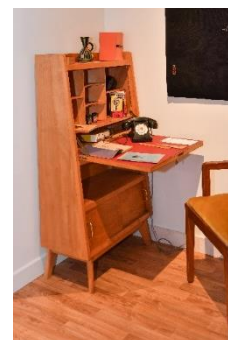
Bureau de l'appartement témoin