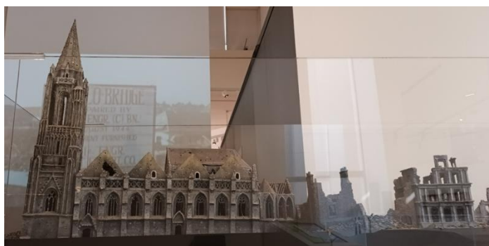
Maquette du centre de Saint-Lô détruit, avant 1992