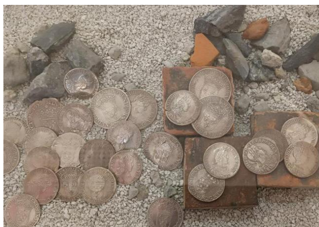
Ecus provenant du Trésor de Saint-Lô