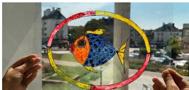
Exemple de production