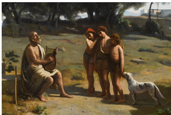
Corot, Homère et les bergers , 1845